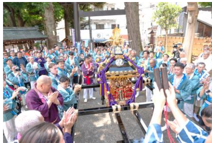
令和5年神幸祭 本社神輿の宮入りの様子 総勢150名の神輿渡御となりました

昨年は4年ぶりに神幸祭を斎行することができました。氷川神社では令和元年の御代変わりの年に本社神輿が誕生し、氷川神社、そして高円寺氏子地域で初めての神幸祭を斎行することができました。今年も昨年同様の内容での開催ですが、氏子地域の皆様には立派な本社神輿を見て戴ければと思います。