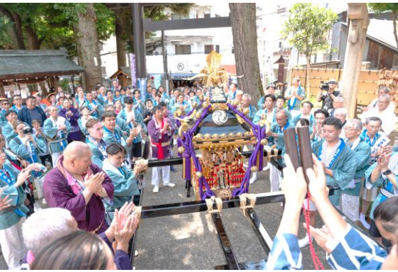
令和5年神幸祭の様子 4年ぶりに本社神輿が高円寺氏子地域を 巡幸しました