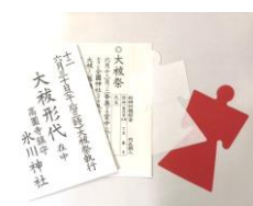
※現在、人型の色は白のみとなります