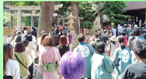
土曜日ということもあり、境内は終日多くの参拝者で賑わいました