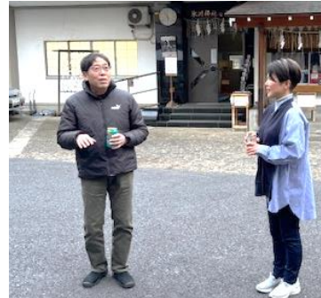
テレビでおなじみの気象キャスター・森朗さんにもご参加戴きました