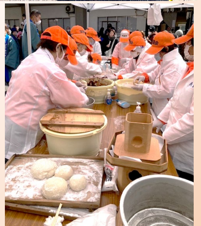
宝扇会の皆様に600人分のお餅を作って戴きました