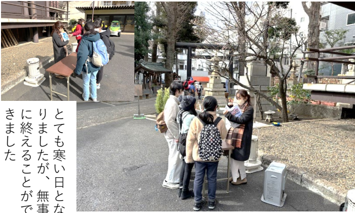
とても寒い日となりましたが、無事に終えることができました

3月2日(土)高円寺横断ウルトラ・ラリーが開催されました。自分たちが暮らすこの高円寺をより知って愛着を持つとうと、平成5年度から始まったウルトラ・ラリーですが、コロナ禍のため、しばらく中止が続きました。今年度は5年ぶりに開催することができました。約70名の児童たちが高円寺の町を歩き、各スポーツでクイズゲームなどをクリアし、得点を競うものです。気象神社も今回からスポットの一つになり、お天気に関するクイズを2問出しました。