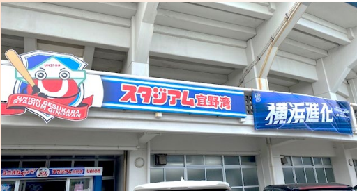
キャンプ地球場のユニオン ですからスタジアム宜野湾