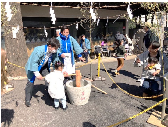
子どもたちも貴重な体験ができました

ひな祭り餅つき大会当日は朝から気温が上がり、抜けるような快晴となりました。早朝から神社境内に集合し、準備に取り掛かりました。前日に下ごしらえしたもち米を炊き、できあがった餅はすぐに石臼に運ばれ、餅つきが始まりました。一人ずつ掛け声をかけながら餅をつきました。出来上がった餅は高南宝扇会の皆様が一つつ形を整え、あんこやきな粉を添えて戴きました。