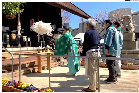
一番餅を氏神様に奉納してから、お祓いをしました