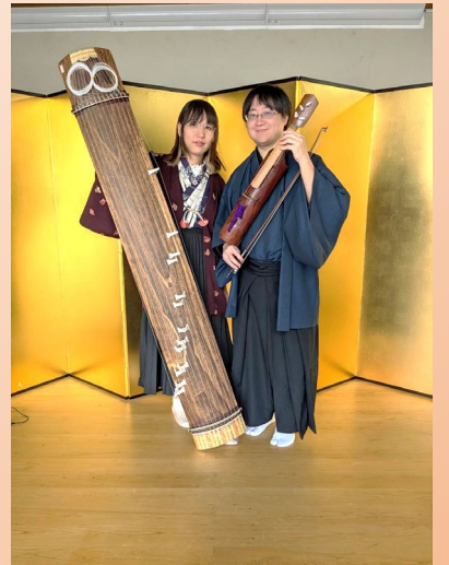
パルポップスコンサートによる和楽器の演奏