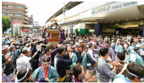
令和元年神幸祭のようす 本社神輿が初めて高円寺氏子地域を巡幸しました

高円寺駅の北口南口周辺の車道を本社神輿が巡幸します。大変ご迷惑をおかけしますが、ご理解とご協力を宜しくお願い申し上げます。