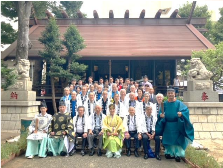
神事後に記念撮影