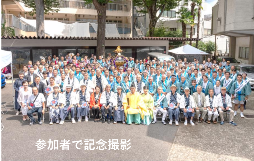
参加者で記念撮影