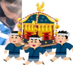
神幸祭のようす(宮入り後)