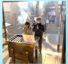
昨年の初詣の様子

氷川神社では、新年清祓(初詣)を始め、厄祓い、その他各種祈禱を承っております。年の始めに是非、神恩感謝と弥栄、安寧を祈願いたしますよう。マスク着用、アルコール消毒、換気など感染対策を徹底します。