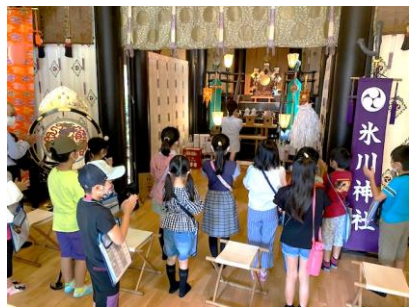
神社の由緒や参拝方法を学びました