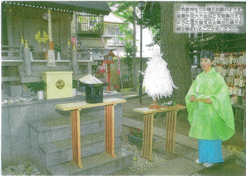
気象神社での晴天祈願の様子。催事や花火大会などを無事行えるように、主催する企業から晴天祈願を頼まれることが多いそうだ。